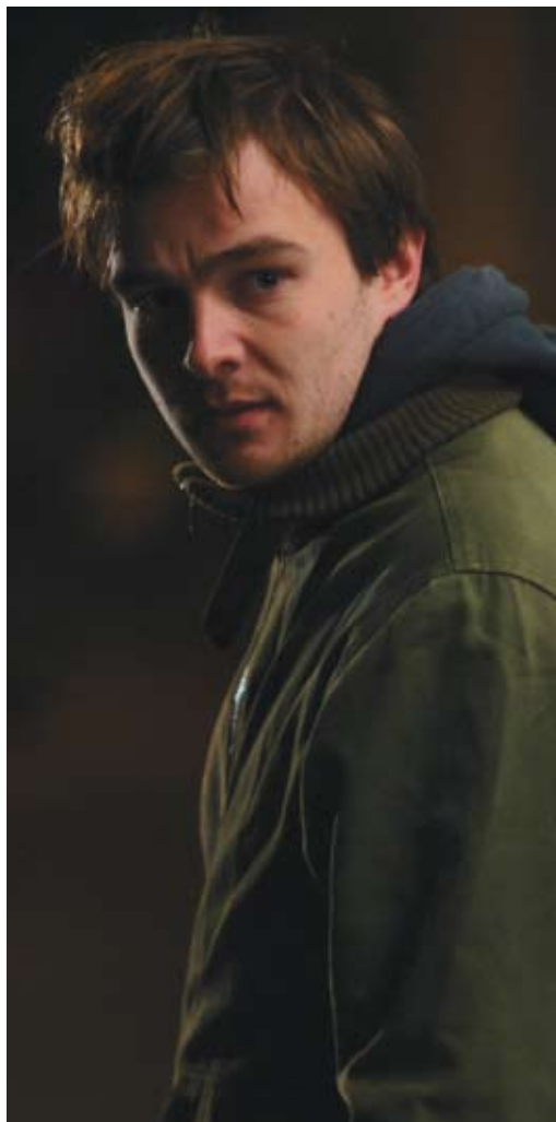
Still fra Traume.dk-filmen "Hvad er traumer?"