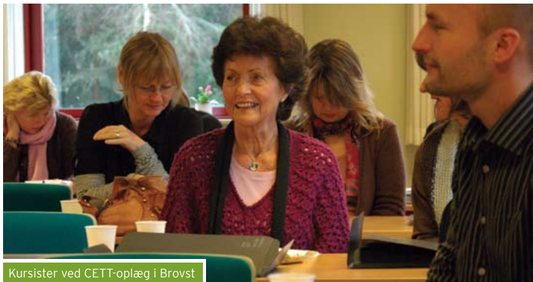
Kursister ved CETT-oplæg i Brovst

feltet, mens kursisterne repræsenterer en bred vifte af fagligheder.