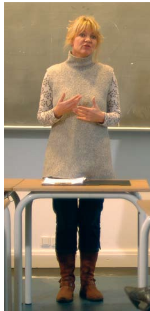
Still fra Traume.dk-filmen "Hvad er traumer?"

Underviserne er i alle seks temadages tilfælde psykologer med mange års erfaring på