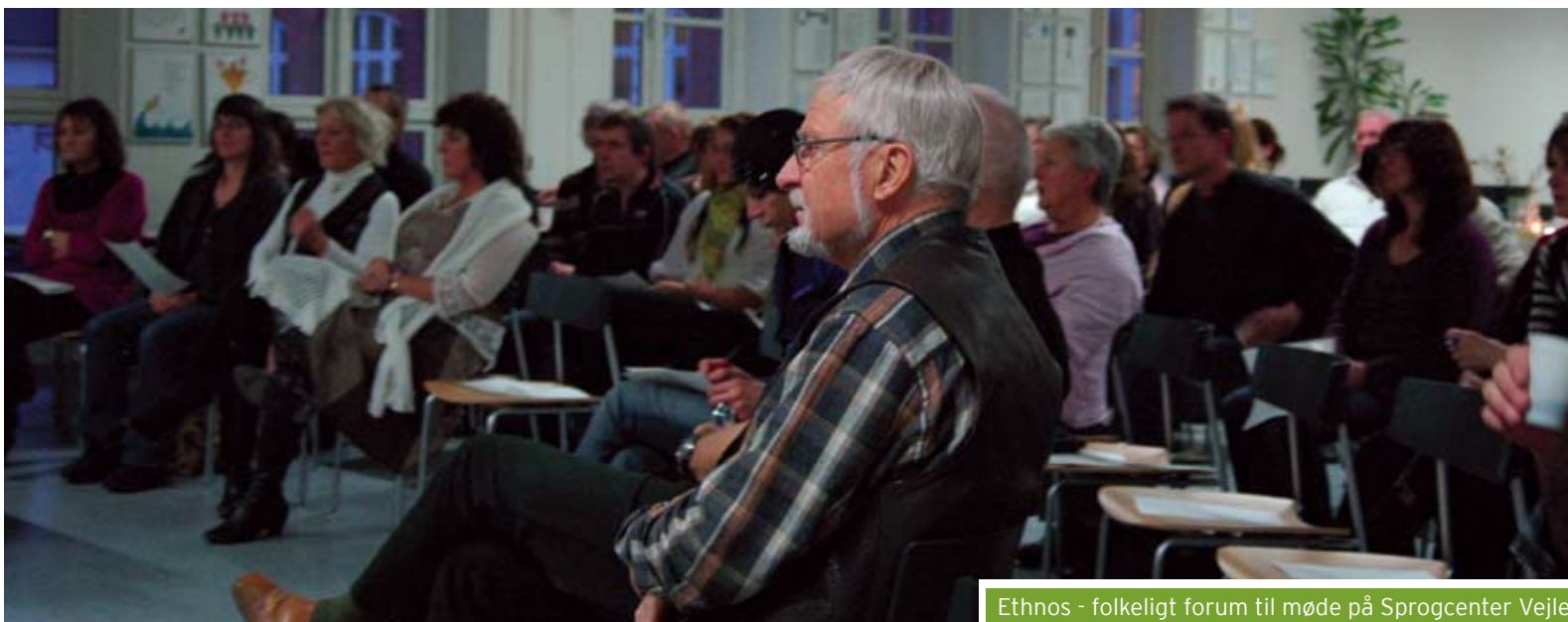
Ethnos - folkeligt forum til møde på Sprogcenter Vejle

Læs mere om behandlingen på CETTs hjemmeside, www.cett.dk